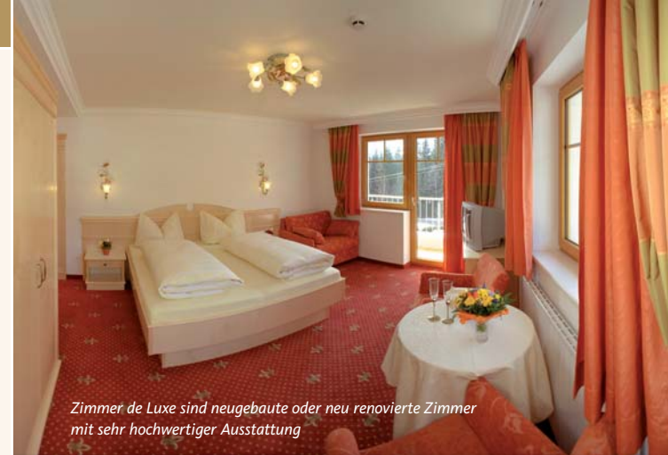
Zimmer de Luxe sind neugebaute oder neu renovierte Zimmer mit sehr hochwertiger Ausstattung