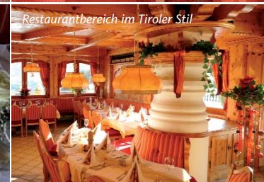
Restaurantbereich im Tiroler Stil